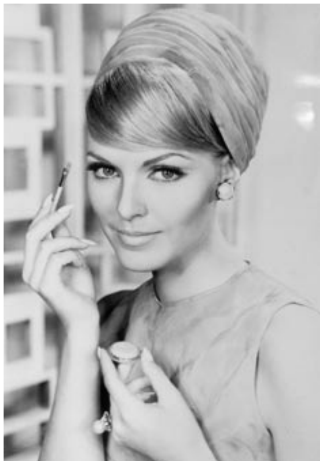
Modelfoto for Max Factor make-up, 1965.