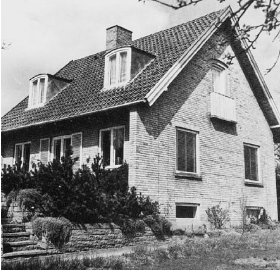
Huset på Kagsåvej. I dag har det husnummer 40.

at de katolske lande ikke kunne lide sangen, som sluttede af med, at Birthe Wilke gav Gustav Winckler et kys, så de katolske lande gav sangen færre point end de ikke-katolske! Raquel Rastenni var både sanger og skuespiller, og sang bl.a.: Heri vores hus; Heksedansen; Her kommer mutter med kost og spand, m.fl.