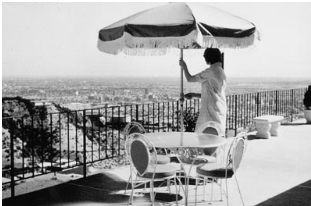
Udsigt fra Ainos store villa over Los Angeles by.

datidens topfotograf med atelier i Amaliegade i København.