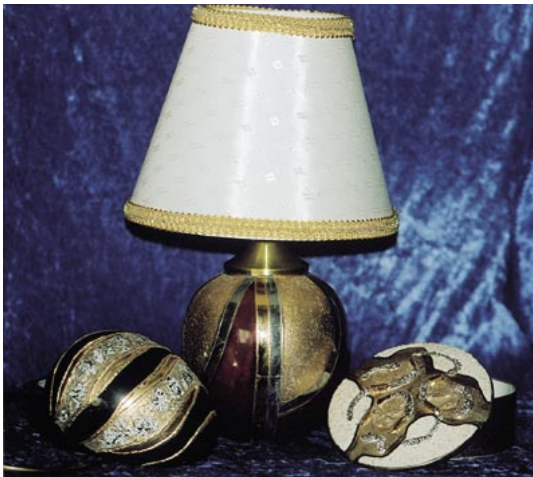
Lampe med guld, platin og matte farver med mælkepulver. Desuden en lille skål med låg, hvor strukturerne er lavet i I-relief, glycerin og sand. På den lille æggeformede skål, er glasuren sprængt af.

Da filmarbejdet i Danmark var slut i 1965 rejste Aino til USA og slog sig ned i Californien. Med sig i sin kuffert havde hun en sum penge at klare sig for en tid i USA, pas, men ikke visum og en mappe med modelbilleder bl.a. taget af Guldbrandsen, som var